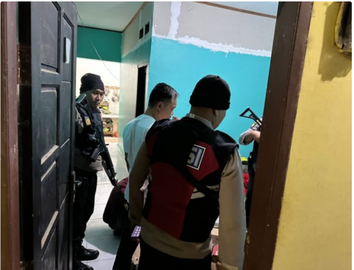
Tampak aparat kepolisian Morowali lakukan razia

MOROWALI, Sulawesi Tengah- Kepolisian Resort (Polres) Morowali tidak Panas Panas Tai Ayam, merespon cepat dan menindak tegas keluhan dari para tokoh masyarakat terkait peredaran Minuman Keras (Miras) yang selama ini cukup