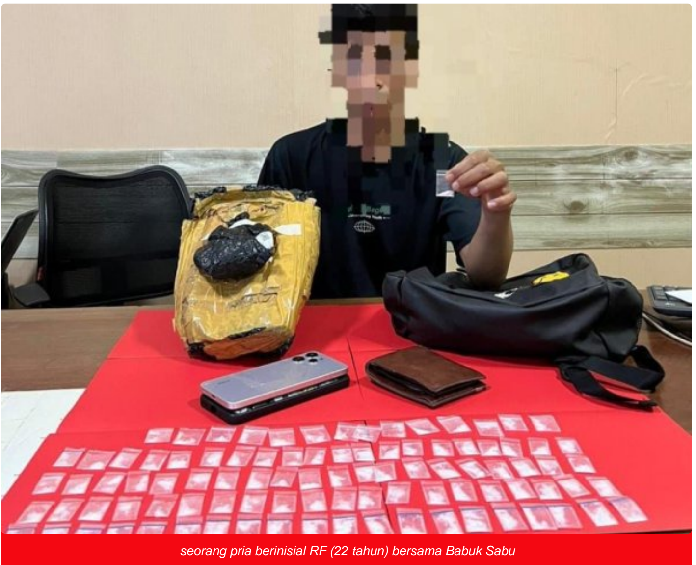
seorang pria berinisial RF (22 tahun) bersama Babuk Sabu

MOROWALI, Sulawesi Tengah- Personel Satuan Reserse Narkoba (Satresnarkoba) Polres Morowali kembali menunjukkan komitmennya dalam memberantas peredaran narkotika di wilayah hukumnya pada hari Senin pagi