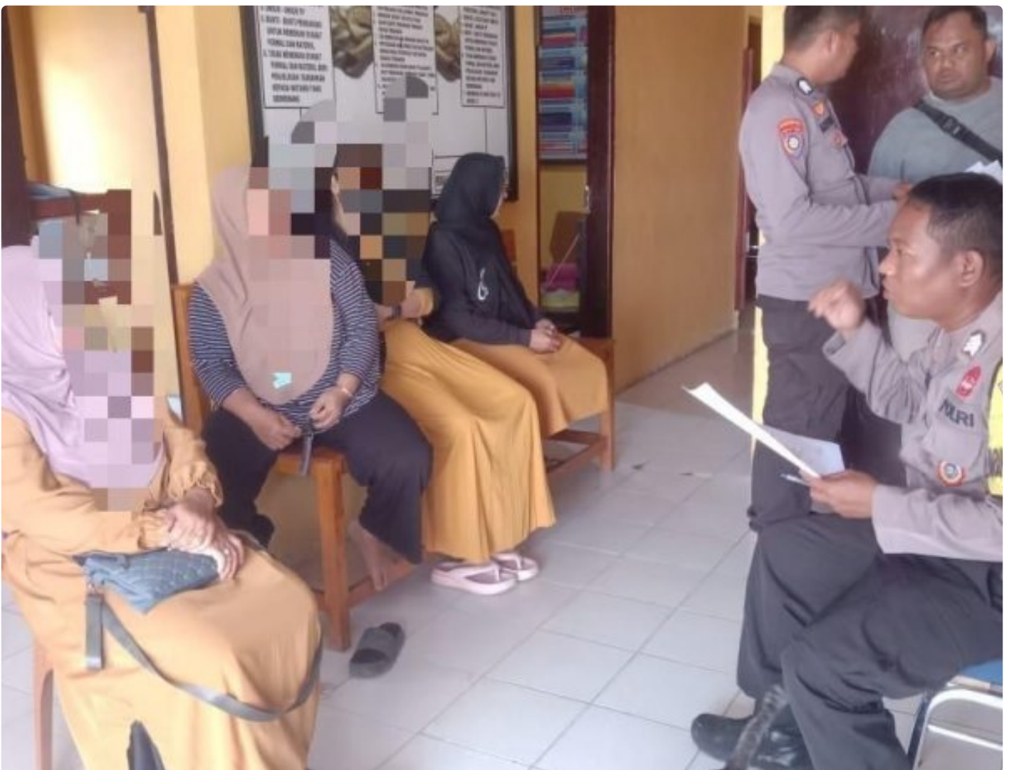
Personel Polsek Bungku Barat Gerak Cepat Lakukan Problem Solving