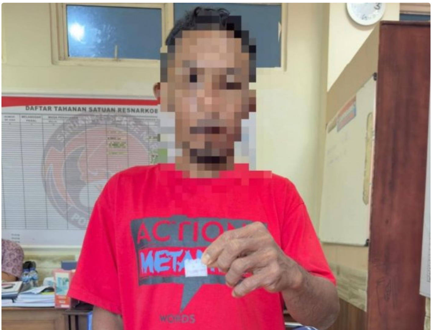
Pelaku Penyalahgunaan Narkotika jenis sabu diringkus dari Desa Lele