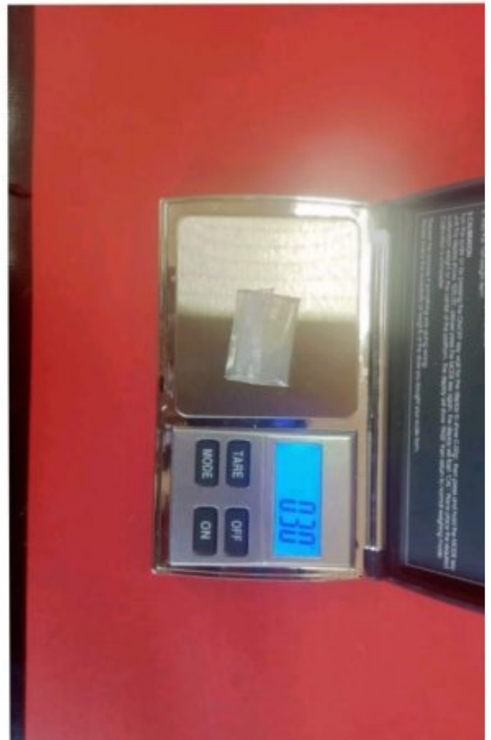
Terduga Pelaku MT dan barang bukti narkotika

MOROWALI, Sulawesi Tengah- Kepolisian Resor (Polres) Morowali berhasil mengungkap kasus penyalahgunaan narkotika golongan I jenis sabu di Desa Labota, Kecamatan Bahodopi, Kabupaten Morowali.